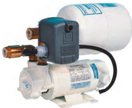
IDROMINI ACB 61G

Automatic running water pressure systems