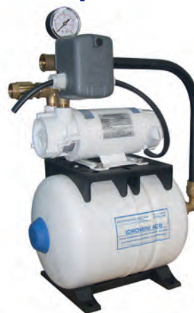
IDROMINI ACB 61G 8L - SPECIAL VERSION

Automatic running water pressure systems