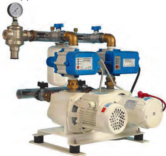
2 JET 4B (Bronze) C.E.