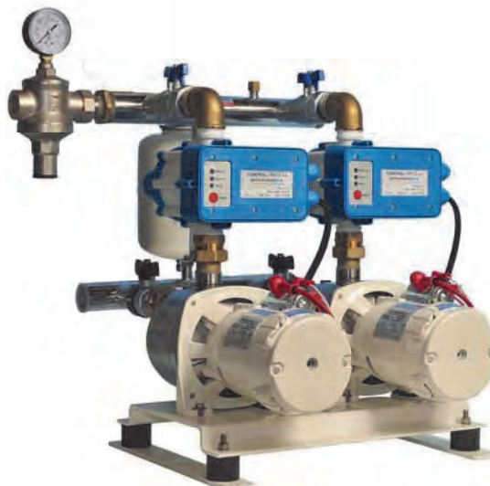
2 ECOINOX 2 C.E.